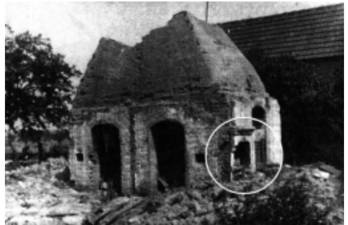
Die Ruine des ehemaligen Armenhauses in Meinsdorf zeigte noch einen Leuchtkamin, in welchem sicher auch Klemmkuchen gebacken wurden.