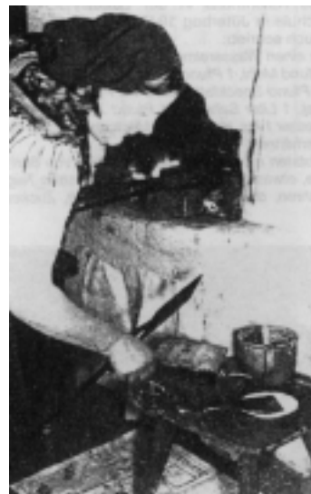
Klemmkuchenbacken in einem Wandkamin in der Stube 1930er Jahre.

Ein Foto aus den 1940er Jahren von der Ruine des ehemaligen Armenhauses in Meinsdorf zeigt einen Stubenkamin in den massiven Mauern des Küchenblocks. Schließlich erhielt ich ein Foto aus den 1930er Jahren, welches eine Frau beim Backen an einem Stubenkamin zeigt