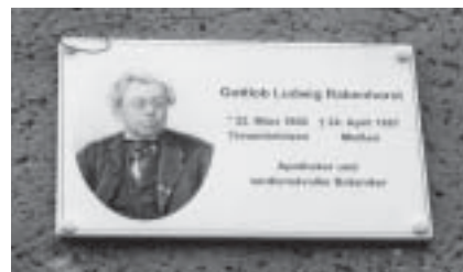
Enthüllung der Gedenktafel für Gottlieb Ludwig Rabenhorst in Meissen