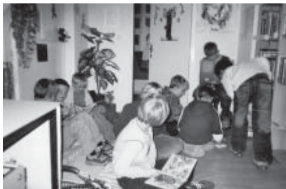
Eine Pause mal anders „Was liest du denn da?“

Die Schulbibliothek der Albert-Schweitzer-Grundschule ist bei den Kindern recht gut angekommen. In den Pausen ist immer etwas los. Schon 68 Schüler haben sich einen Benutzerausweis angeschafft. Mit diesem Ausweis können sie in der Stadtbibliothek auch Medien ausleihen. Bis zu 40 Schüler besuchen die Schulbibliothek täglich und ca. 25 bis 30 Medien werden ausgeliehen.