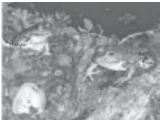
Teilnehmerbeitrag aus dem Fotowettbewerb 2007, Astrid Bornkessel, Gottsdorf: „Zwei grüne Freunde“

Noch bis zum 31.12.2008 können Motive aus dem Naturpark Nuthe-Nieplitz unter folgenden Teilnahmebedingungen zum laufenden Fotowettbewerb eingereicht werden: