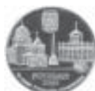
Silbermedaille der Potsdamer Münzfreunde e.V.

herausgegeben 2006, anlässlich des 40-jährigen Vereinsjubiläums